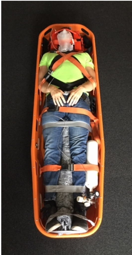
Person på spineboard lagt i hejsebåre.